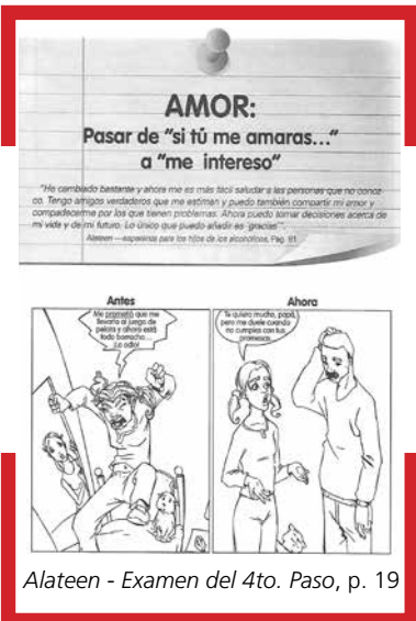
Alateen - Examen del 4to. Paso, p. 19