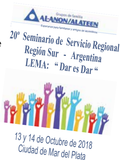
Comité Anfitrión de Seminario 2018 Distrito Integración

Nos vemos en el Seminario de la Región Centro en octubre de 2019.