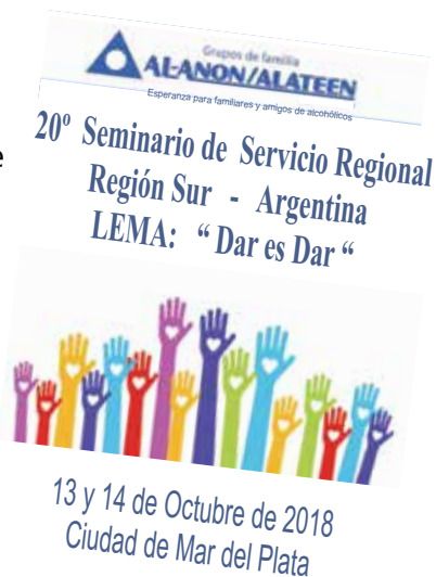
Comité Anfitrión de Seminario 2018 Distrito Integración

Nos vemos en el Seminario de la Región Centro en octubre de 2019.