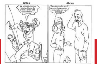
Alateen - Examen del 4to. Paso, p. 19